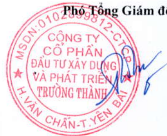
Trần Huyền Trang