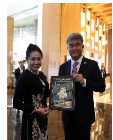
Lễ trao quà tặng giữa Trường Thành Group và Deawoo E&C