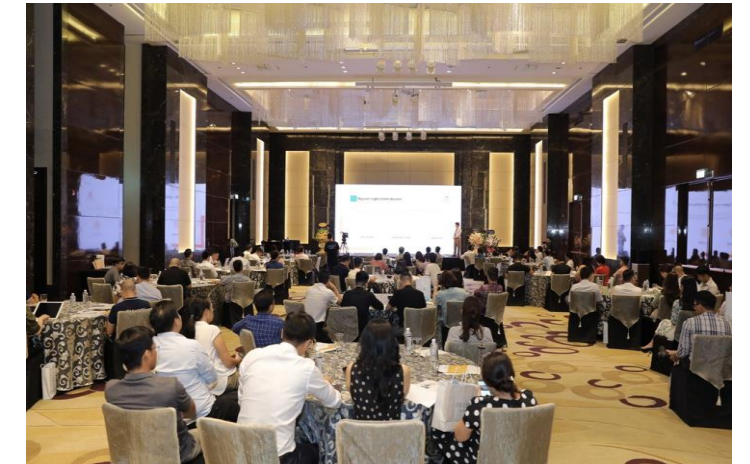
Roadshow giới thiệu cơ hội đầu tư cổ phiếu Trường Thành Group - TTA