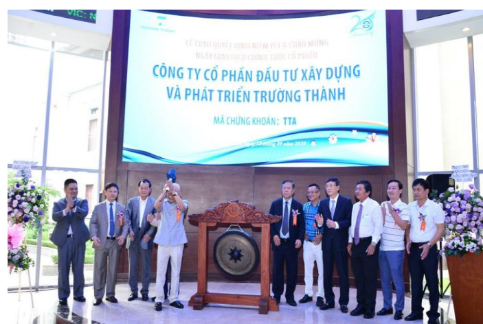
Lễ chào sàn HSX của cổ phiếu Công ty (TTA)