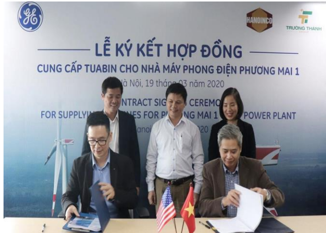
General Electric tổ chức lễ kí kết hợp đồng cung cấp tuabin gió cho Nhà máy Phong điện Phương Mai 1