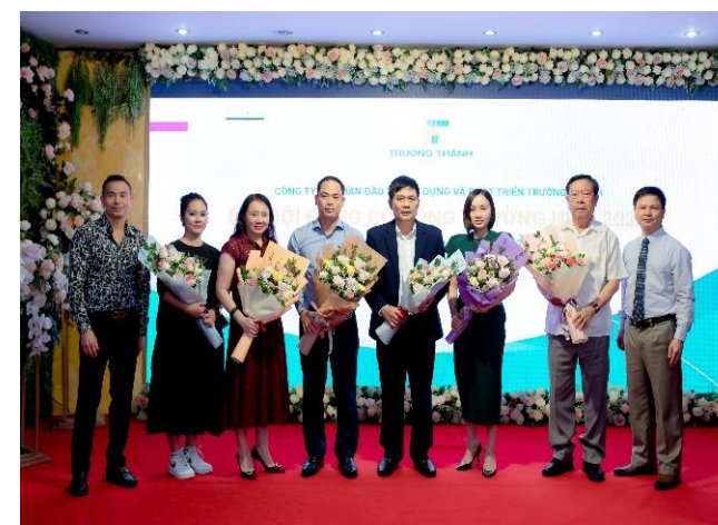
Họp Đại hội đồng cổ đông thường niên năm 2023