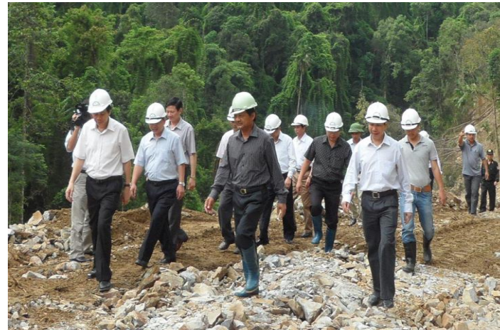
Đón tiếp lãnh đạo tỉnh Yên Bái đến thăm và làm việc tại Thủy điện Ngòi Hút 2