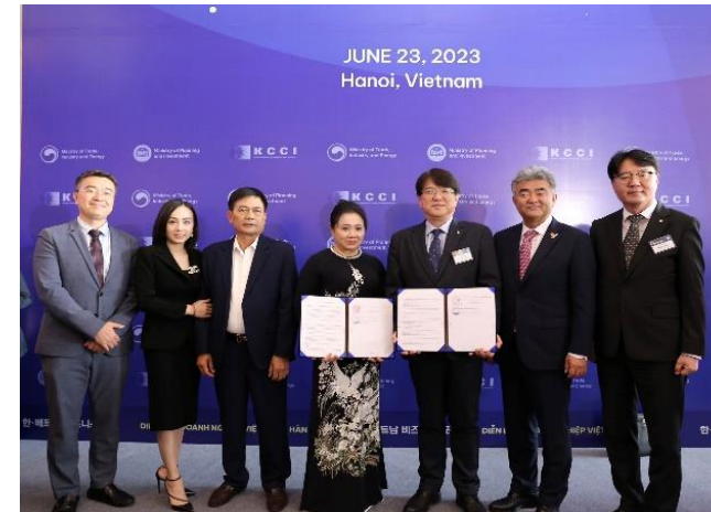
Biên bản ghi nhớ hợp tác giữa Trường Thành Group và Deawoo E&C