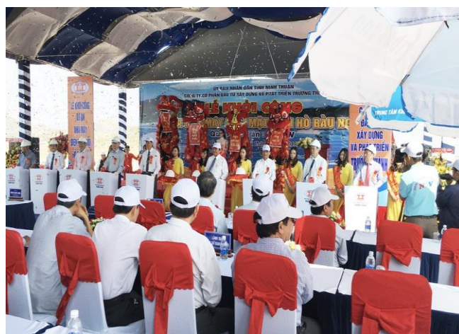
Lễ khởi công nhà máy Điện mặt trời Hồ Bàu Ngự